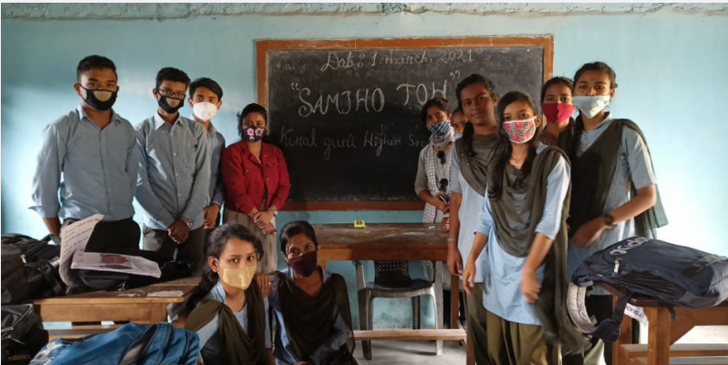
समझो तो कोहोर्ट

784 युवा लोग | 60 युवा कार्यकर्ता | 57 संस्थाएं | 16 राज्य